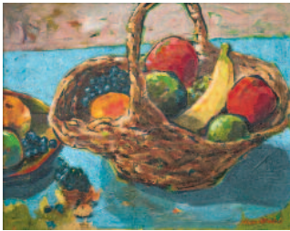
Stillleben I, maleri.