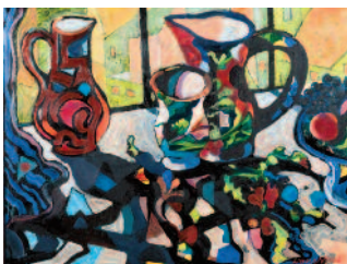
Stillleben II, maleri.