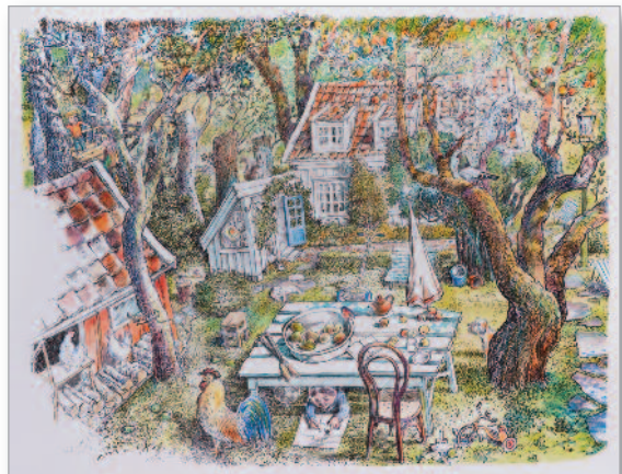
Borgentoppen 16, litografi