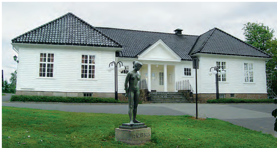
Venskaben, innviet i 1905, har vært Høstutstillingens «hjem» siden 1970. Foran står «Asker-piken», LC Askers gave til bygda, som ble avduket i 1974.