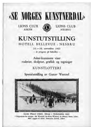
Katalogen for 1965 med separatutstilling av Gustav Wenzel.

En annen viktig nyskaping kom dette året: Kunstnerstipendet. Etter idé fra Bjørn Storberget ble det bestemt å gi et stipend til en ung,