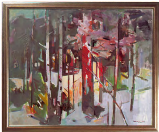
Fra minneutstillingen for Tore Hamsun i 1997.

Et nytt grep ble gjort året etter. Åpningstiden, som nesten fra starten i 1963 hadde vært onsdag til søndag – 5 dager – ble utvidet til 9 dager for å få med to helger. Det ble en umiddelbar økonomisk suksess. 2005 ble for øvrig et svært